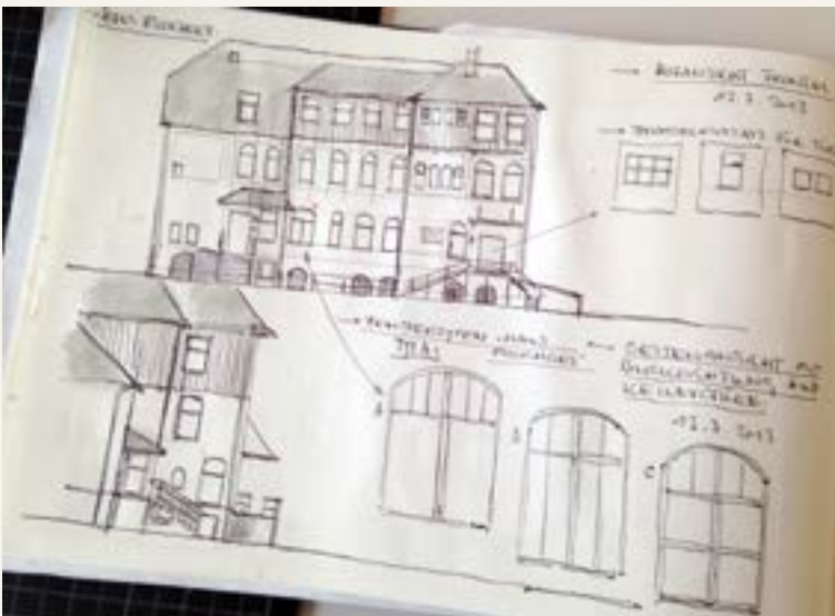
Skizzen zum Setdesign von Christian Strang